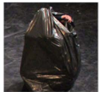
Sac à poubelle