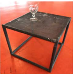
Table et verre